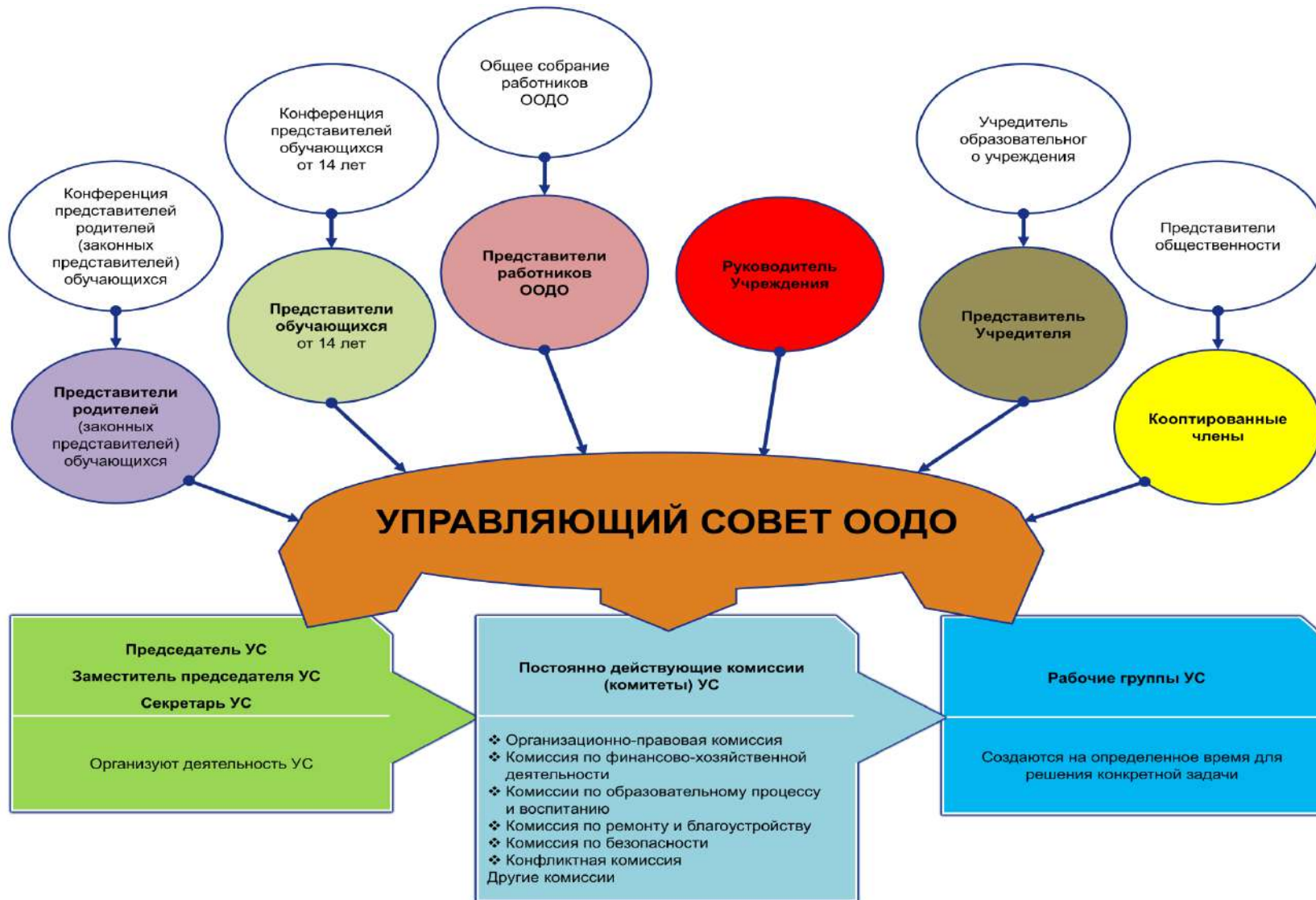
Рис. 2. Модель № 2 – «Структура управляющего совета в образовательной организации дополнительного образования» (УС ООДО)