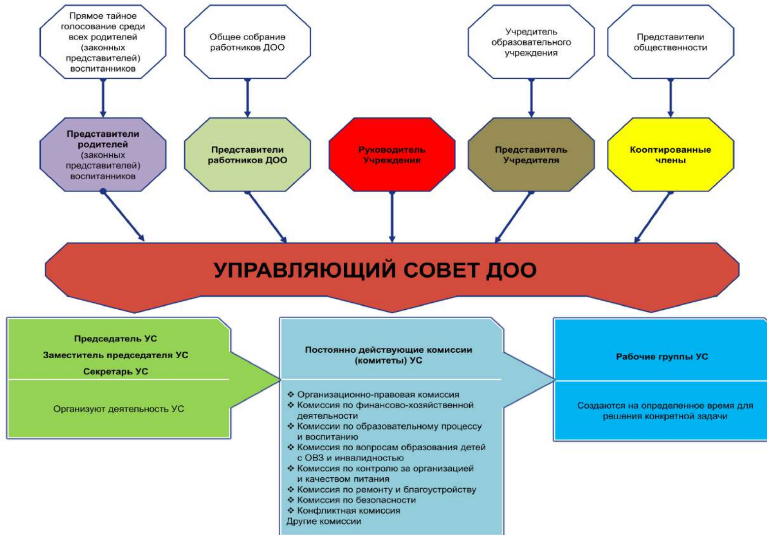
Рис. 3. Модель № 3 – «Структура управляющего совета в дошкольной образовательной организации» (УС ДОО)