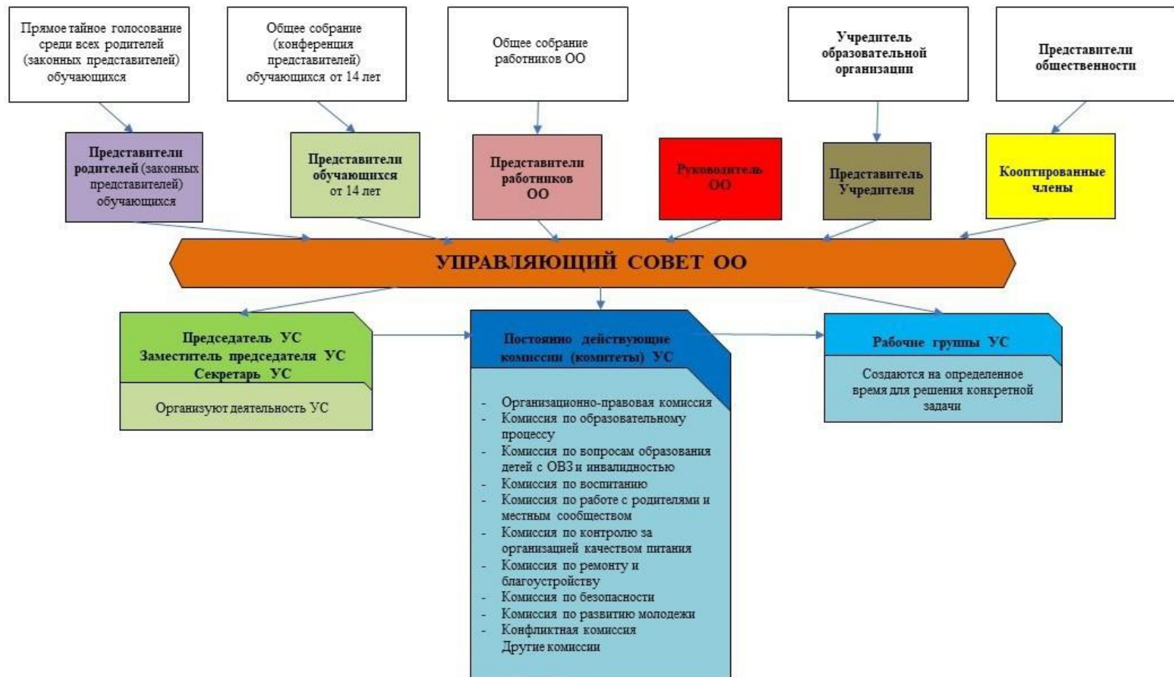
Рис. 1. Модель № 1 – «Управляющий совет общеобразовательной организации» (УС ОО)