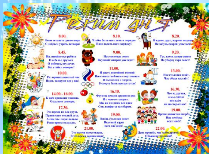
График проведения смен в ЦТО «Космос»