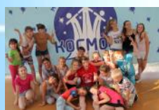
Дружный коллектив детей