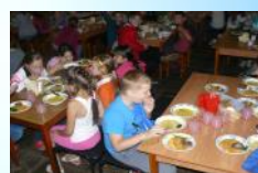
Вкусное и здоровое питание