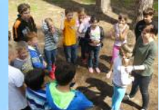
Тренинги на сплочение